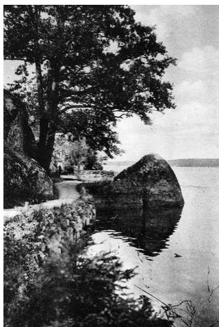
Набережная под Марьиной горкой. Фотоснимок нач. XX в.